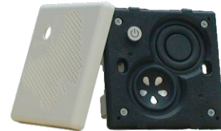
SW8611-0 with butterfly panel